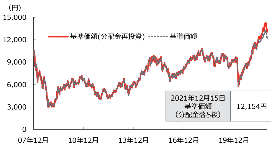
期間別運用実績（騰落率） （基準日：2021年12月15日）