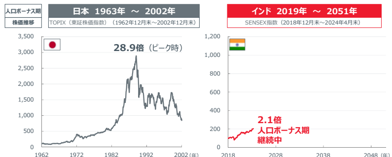
図表 日本・インドの人口ボーナス期における株価推移

2022年以降の人口ボーナスは予測値。株価指数は開始時点をも100として指数化。すべて月次、プライス・リターン、現地通貨ベース。