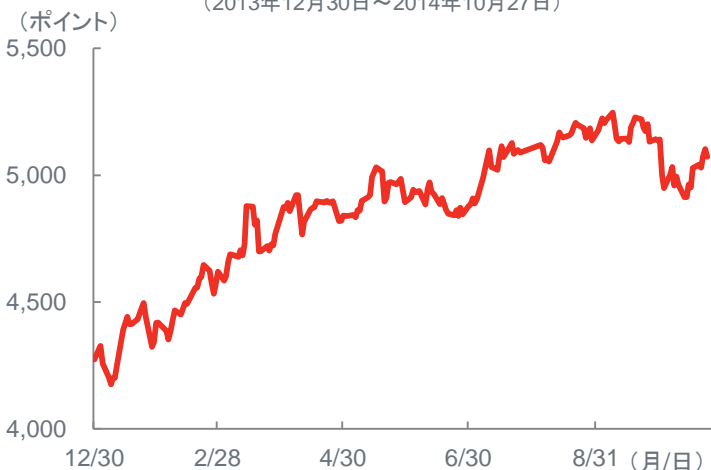
(図表3) ジャカルタ総合指数の年初来推移 (2013年12月30日~2014年10月27日)