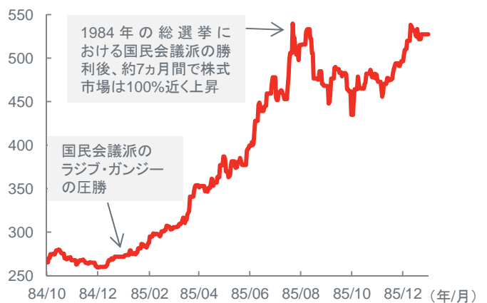
SENSEX指数の推移(1984年10月1日~1985年12月31日) (ポイント)