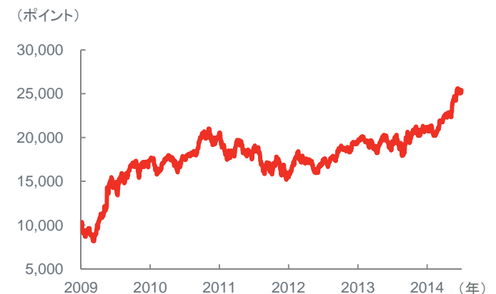
SENSEX指数の推移(2009年1月~2014年6月末)