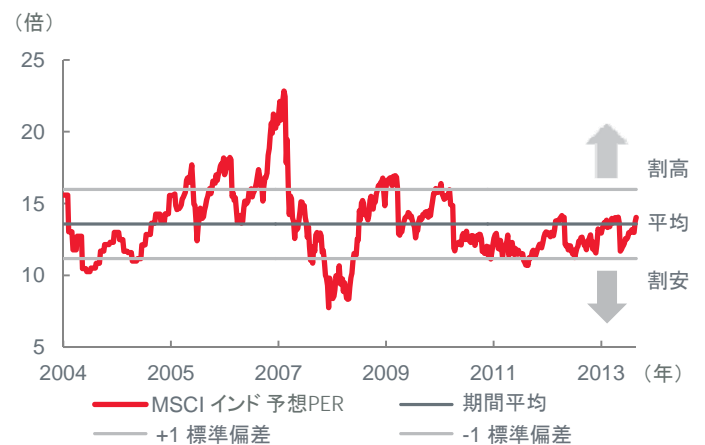
MSCIインド 予想PERの推移(2004年1月16日~2014年5月23日)