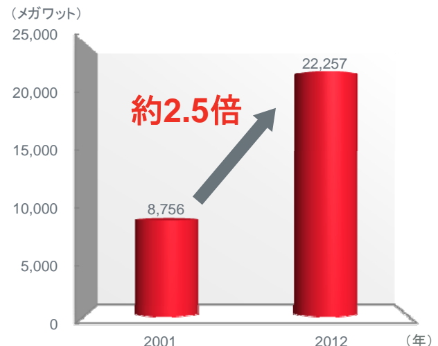
グジャラート州の発電能力の伸び